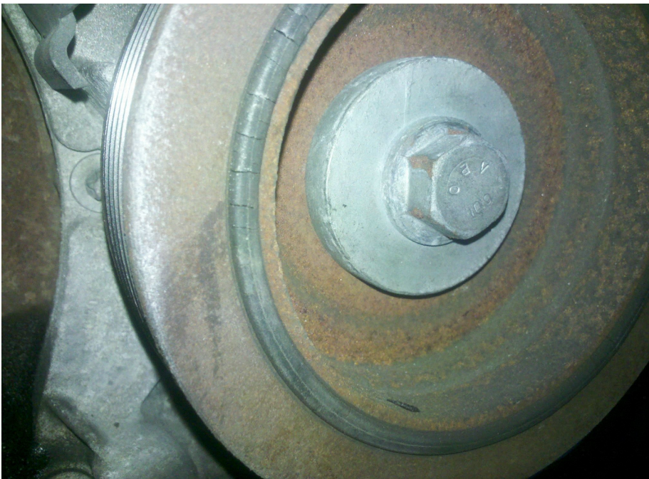
Poulie que j'ai considéré à changer

7ens ite +! s p! +eB c! $ $an(e# +!s piCces