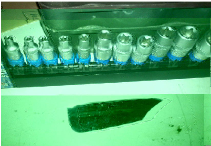
Douille E** et miroir