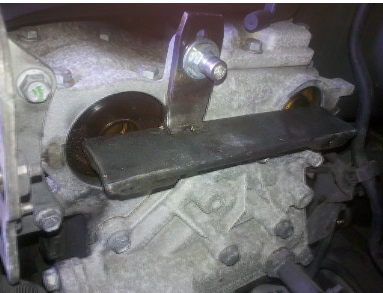
Blocage des arbres à cames