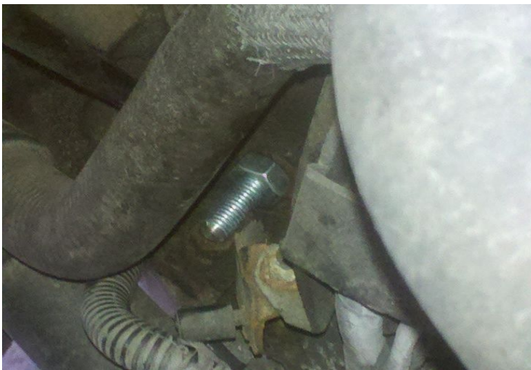
Pige en place

NB E t! ;! #s t! #ne# %e $ !te # (ans %e sens (e %a $a#c1e