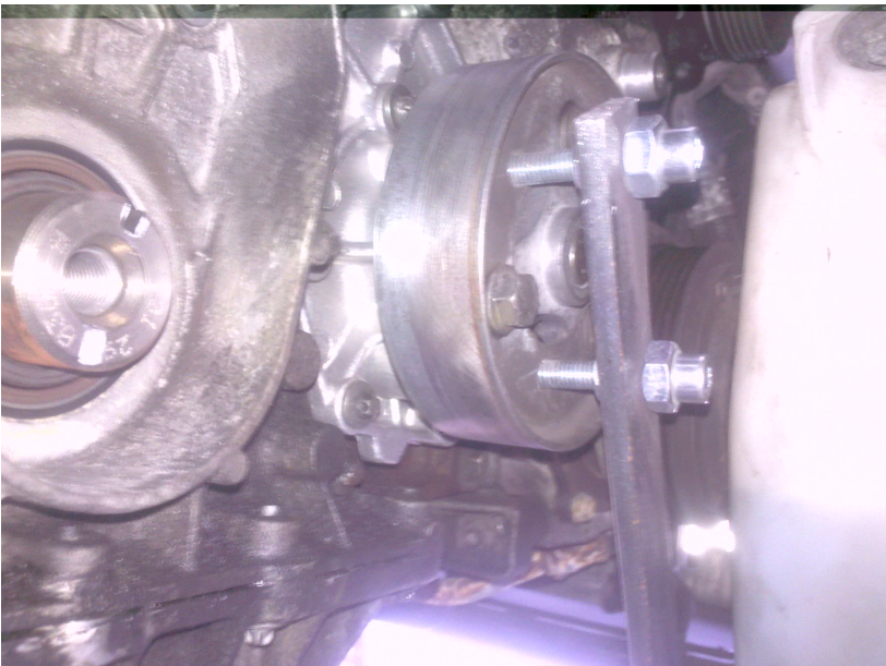
Blocage de la poulie pour faciliter le serrage/desserrage

73e n'ai pas e " en%e+e# %e #&se#+!i# (e %a+e 6%ace